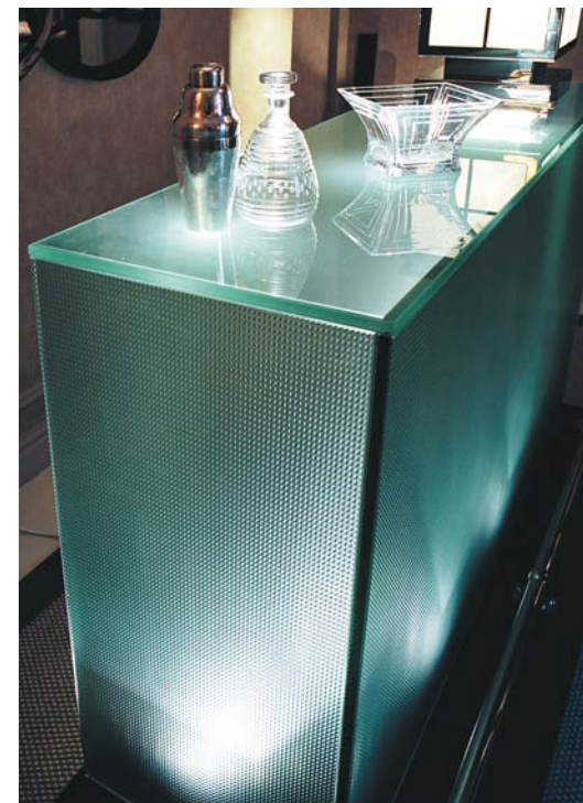
Mueble-bar retroiluminado de SGG BALDOSA GRABADA. Estudio de interiorismo: Custom Made, S.L. Casadecor'04, Madrid.

Pisables realizados con SGG BALDOSA GRABADA. Centro Comercial Equinoccio, Majadahonda, Madrid.