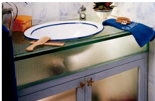
Encimera y frente de SGG BALDOSA GRABADA 19mm. Interiorismo: Miren de Mújica.