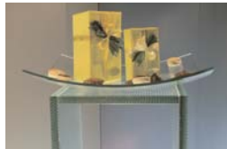
Peana con SGG BALDOSA GRABADA Salone del Mobile, Milán.

Como todo diseño de la gama de vidrio impreso SGG DECORGLASS, SGG BALDOSA GRABADA se fabrica conforme a la norma UNE EN 572 Vidrio para la edificación, productos básicos de vidrio, vidrio de silicato sodocálcico, parte 5: vidrio impreso.