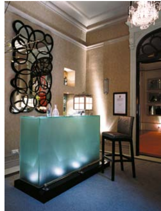
Estudio de interiorismo: Custom Made, S.L. Casadecor'04, Madrid.

Algunas aplicaciones, tales como pisables, requieren el cumplimiento de determinadas especificaciones de transformación e instalación por parte de profesionales cualificados. Consulte con CITAV, nuestro Servicio Técnico.