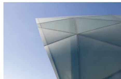
SatenGlas® 8 y 10 mm Hangar 7-8. Salzburg Airport (Austria)